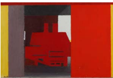
Rød ladeport, rød mejetærsker, 1950