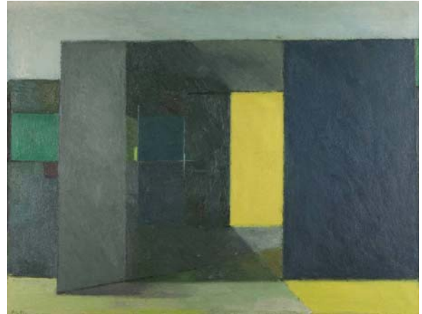
Gård. Råbjerg, 1956-58.

Malerierne synes ved første øjekast meget flade, men takket være måden de forskellige farveflader er placeret på lærredet, danner sig igen et rum i billedet, og vi kan aflæse billedets motiv. Til venstre i billedet ser vi en hvid mur med sort bindingsværk. Blikket føres ind i en portåbning, der ligger straks til højre for den hvide mur. Solen skinner i baggrunden. Det kan vi se, fordi døren til den anden side af laden står åben. Det, der ved første øjekast måske var en lukket flade, er blevet til et kighul i maleriet.