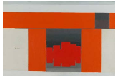
Ladeport og høstmaskine i frostsne, 1976.