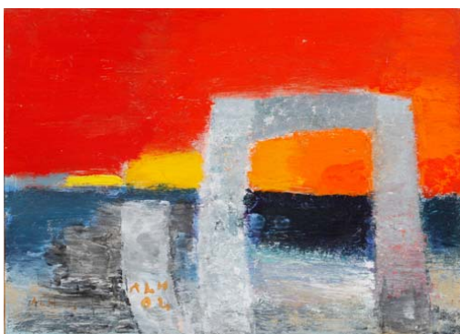
En gæst på stranden, (Flyvende hollænder), 1993/2004.

Opgave 2. Mal et landskabsmaleri, hvor vejret beskriver dine følelser eller drømme.