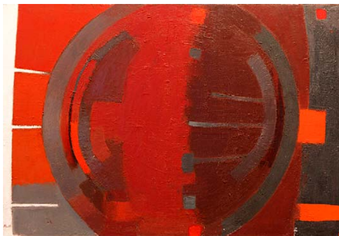
Smedens fyraften, 1968-69.

I f.eks. maleriet Stålværk. Teglholmen (se forsiden) har Arne L. Hansen fanget sit motiv på lærredet i form af glødende orange og gabende sorte felter. Billedets farveklang er meget enkelt bygget op af få farver; orangerødt, sort og stålgråt. Smelteovnene står åbne, og deres vældige gab afslører en glødende masse af smeltet jern, fastholdt af maskinernes enkle, sorte former og lige linjer.