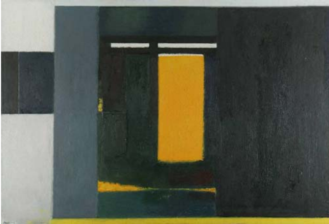
Gård. Råbjerg. Sol, 1955-57.

Flere af Arne L. Hansens malerier synes konstrueret som med lineal. Farvefladerne i malerierne nedenfor er store og sat op ved siden af hinanden i lodrette og rektangulære, skematiske felter. Den gård, som titlerne henviser til, er i billedet bygget op af kvadrater og rektangler. Bygningen er reduceret til enkle, geometriske former – store farveflader i hvid, grå og sort.