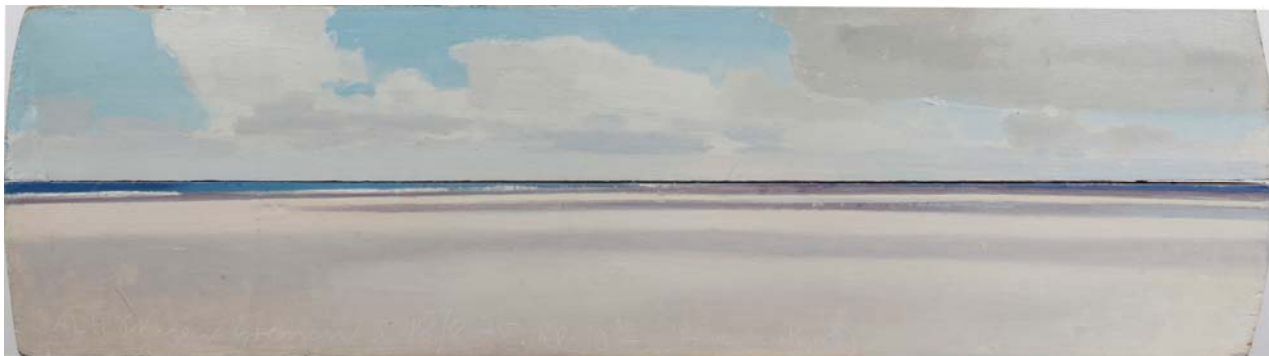
Skagen, Grenen. 18/8 75. Kl. 10.30. Drivende skyer, 1975.