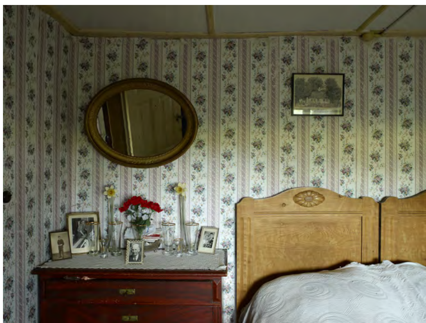
Torben Eskerod: Interiør – Søllested, Lolland, 2012