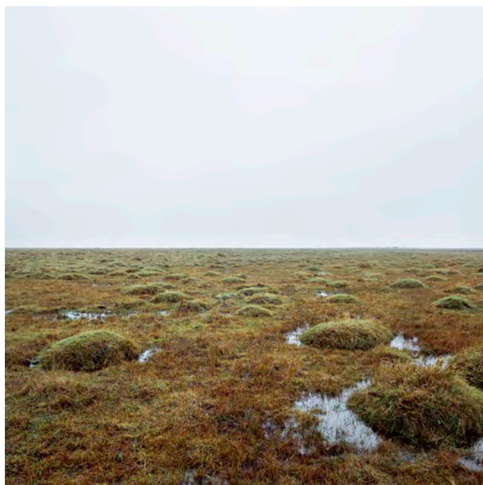
Christina Capetillo: Læsø, oktober, 2012